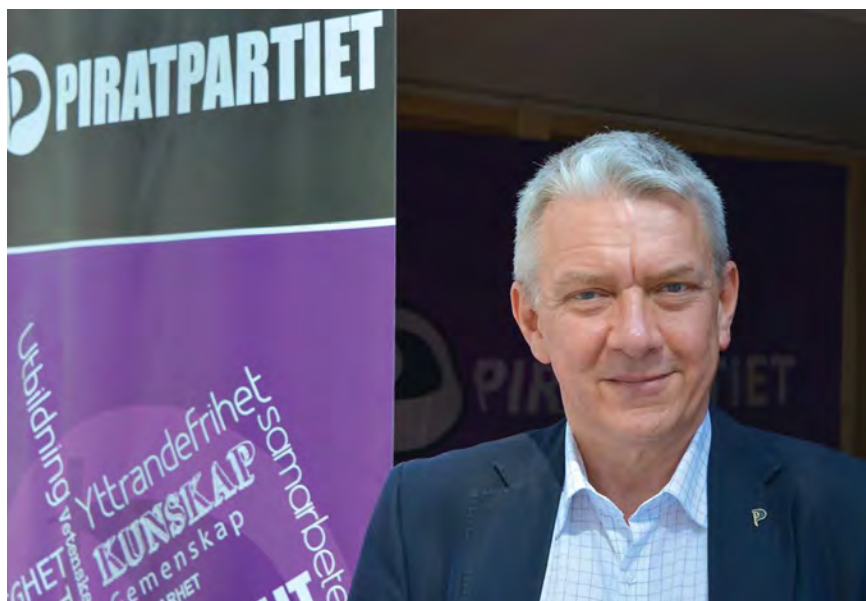
Christian Engström