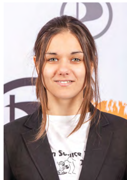
Amelia Andersdotter